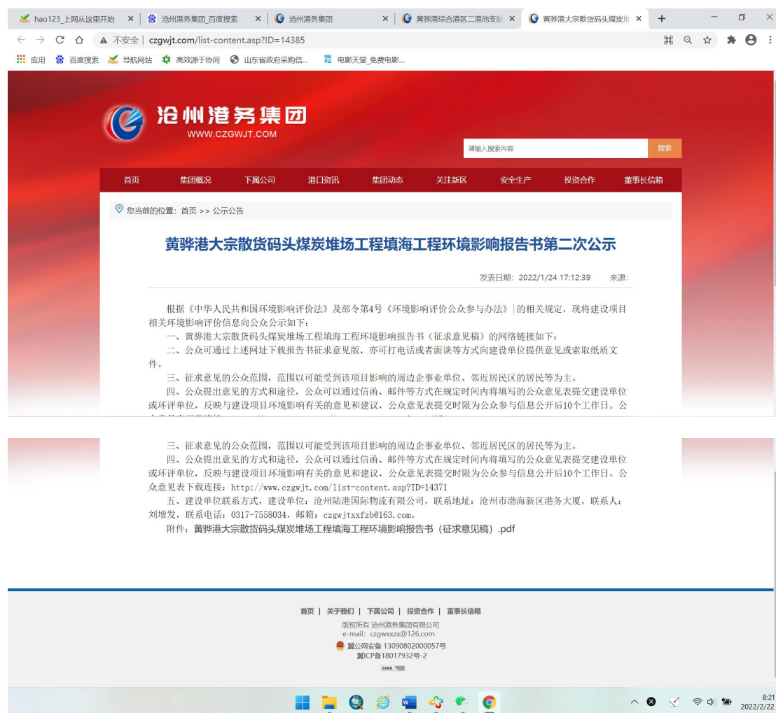
图 3.2-1 第二次网站公示截图