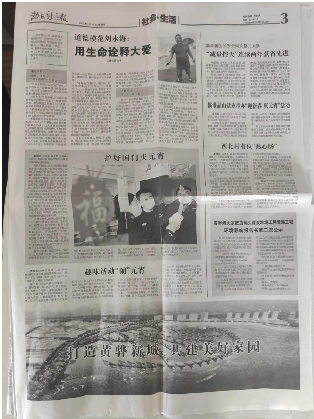
图 3.2-2 报纸公示